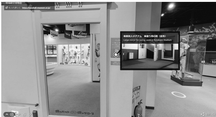
制作事例：野球殿堂博物館

「360度ビューイング」では、360度の高精度写真と3Dスキャン技術により施設内部を忠実に立体再現。スマートフォンやパソコンで、その場にいるかのような視点で自由に散策できます。遠方でなかなか現地に足を運べ