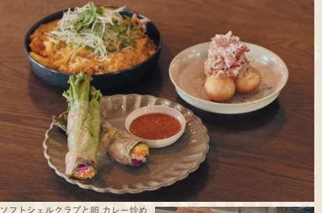
ソフトシェルクラブと卵 カレー炒め 1,980円、モチモチモチン1,500円、生春巻き800円 ※ディナーメニュー

元町ウェルネスパークの誕生と同時にオープン。旧元町小学校の給食室だった場所につくられたため、モダンな中にもノスタルジックな雰囲気が。ランチはしっかりお腹を満たす定食スタイル。夜は医食同源をテーマにした、野菜たっぷりのエスニックメニューをおしゃれに楽しめます。