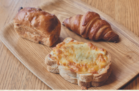
pandaクロワッサン200円、クロックムッシュ360円、ぶどうパン280円

“0歳から100歳まで安心して食べられるパン”がコンセプトのベーカリーカフェ。常時40種ほどの焼き立てパンが店頭で並びます。看板メニューの「panda食ぱん」は、やさしい甘みとふわり食感が人気。イートインスペースもあり、ゆったりとランチメニューもいただけます。