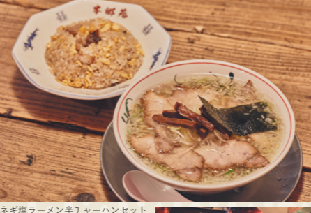
ネギ塩ラーメン半チャーハンセット 1,300円

革新的なラーメンを作り、業界に旋風を巻き起こし続けている水原裕満氏の7店舗目となるお店。豚や鶏からとった透明なスープに村上朝日製麺所のストレート麺を絡めて完成する塩ラーメンは感動的なおいしさ。豚肉のうま味をしっかり感じられるチャーハン(テイクアウト可)も絶品です。