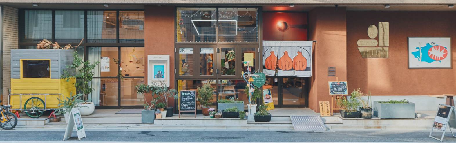
写真・神田ポートビル

出版・製本や印刷業などを中心に栄えてきたエリア。KANDA SQUARE や神田ポートビルといったランドマークが新たなカルチャーを盛り上げつつも、下町らしい昔ながらの賑わいも残っています。そんな新×旧が心地よく融合するまちへ繰り出しましょう。