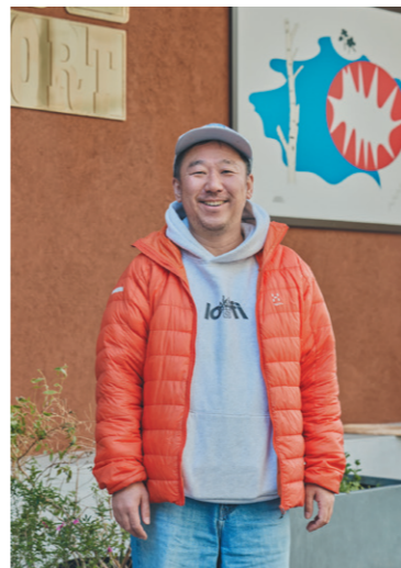
写真・清水洋 取材・文・石部千晶、高橋瑠穂(六歳) ※価格はすべて税込です。 ※データは取材時のものです。内容が変更になる場合がありますので、あらかじめご了承ください。

本業は写真家ですが、「神田ポートビル」の立ち上げをきっかけに、神田に関わるいろいろな活動をしています。「神田ポートビル」は、港のように人や文化の交流ができる場所。ここでほっとひと息ついて、船出になるためのエネルギーを蓄えていってください。クリエイティブディレクションを担うwebメディア「オープンカンダ」では、神田で新参者の自分たちが実際に体験したことなどを記事にして紹介。企画した新しい緑日「なんだかんだ」も回を増すごとに盛り上がっています。神田は地元のみなさんが寛大で、新しいことも楽しんでくれるまちですね。今後は防災や画材循環プロジェクトなどの活動を広げつつ、地域とのつながりをより深めていきたいです。