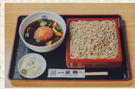
トマト鶏汁せいろ1,500円

1869年創業の蕎麦の名店。神田錦町で唯一現存する木造家屋の店構えも風格たっぷり。「わざわざ来てもらうお店にしたい」と4代目が考案した「しょうが天そば」や「季節の二色せいろ」など、ユニークなメニューは今やお店の名物に。のど越しの良い白い二八蕎麦を粹にいただく。