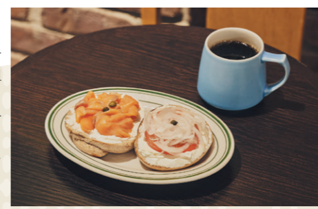
NYCベグルサンド1,400円、バッチ・ブリュー「東京ブレンド」(M)550円

NYのマンハッタンとブルックリンに11店舗を展開するカフェの日本1号店。生産者の具体的な生活改善に取り組みながら育まれたコーヒーを提供しています。6階には子連れ専用のキッズスペースを完備。サンドイッチやスイーツ、キッズミールなど、豊富なフードメニューも魅力です。