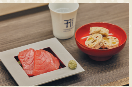
日本酒(60ml)380円へ、本マグロ ハーフサイズ700円、豊島屋バター660円

東京最古の酒舗というだけあり、創業は約430年前。初代が始めた酒屋兼飲み屋を、16代目が1世紀ぶりに復活させました。「江戸東京モダン」がコンセプトのスタイリッシュで明るい店内は女性ひとりでも入りやすい雰囲気。3種を飲み比べできる日本酒の自動販売機も体験してみてもいい?