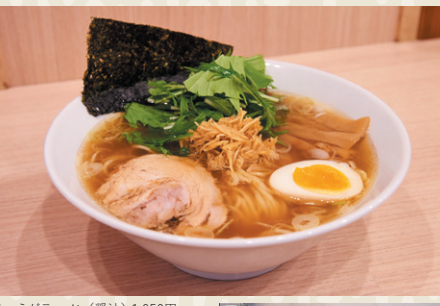
しょうがラーメン(醤油) 1,050円

鶏と魚のダブルスープにしょうがのアクセントが効いた「しょうがラーメン」が不動の人気。高知県産の黄金しょうがを細かく刻み、チャーシューのタレで漬けた特製しょうがは、追いトッピングで倍にする人もいるというやみつきの味。冷房で冷えた体をあたためてくれそうです。