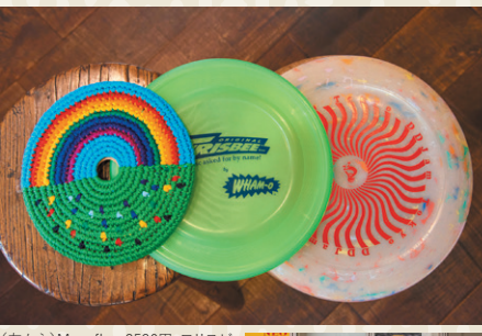
(左から)Mayaflya 2530円、フリスビー 1320円、D.D.Jamオリジナルフライングディスク2,800円