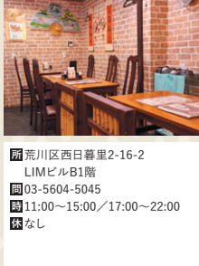
荒川区西日暮里2-16-2 LIMビルB1階 03-5604-5045 11:00~15:00/17:00~22:00 休 なし

野菜とフルーツを組み合わせた甘酸っぱさと、海老せんやナッツの食感が効いた「牛肉のサラダ」がイチオシです