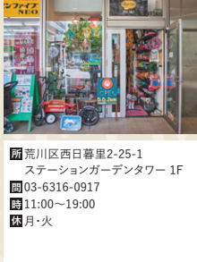
荒川区西日暮里2-25-1 ステーションガーデンタワー1F 03-6316-0917 11:00~19:00 休 月・火

D.D.Jamオリジナルのフライングディスクは、暗い場所でも光るなどデザインに遊びも加えています