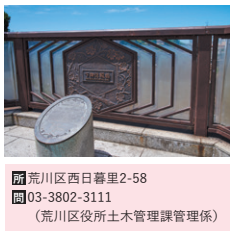
荒川区西日暮里2-58 03-3802-3111 (荒川区役所土木管理課管理係)

日暮里駅の東西を結ぶ跨線橋。橋の中ほどに設置されたパルコニーからは新幹線をはじめ数多くの列車を眺めることができるため、生きたトレインミュージアムとしても知られています。