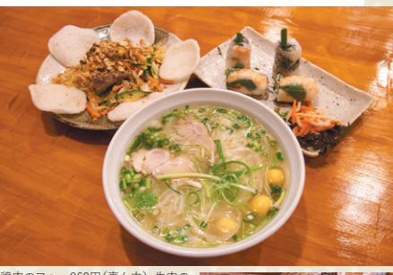
鶏肉のフナー 869円(真ん中)、牛肉のサダダ 803円(左)、豚と海老の生春巻き 605円(右)

オーナーのホさんの出身地、ベトナム中部高原地方の都市・バンメから店名をとっており、ジビエやタウナギなど現地でもよく食べられる食材を取り入れたベトナム料理が人気。アジア圏出身の人もリピートする本格的な味。かつ野菜やお肉がバランスよく食べられるメニューは日常的に食べたくります。