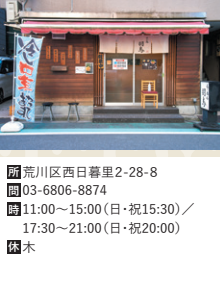
荒川区西日暮里2-28-8 03-6806-8874 11:00~15:00(日・祝15:30)/17:30~21:00(日・祝20:00) 休 木

九州・長崎のチョウワ醤油や、熟成みりんなど、出汁以外の調味料にもこだわっています