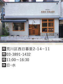
荒川区西日暮里2-14-11 03-3891-1432 11:00~16:30 日・水

期間限定のシャインマスカット大福や水大福も人気。表情もそれぞれ少しずつ違うので、見た目でも味でも楽しんでください