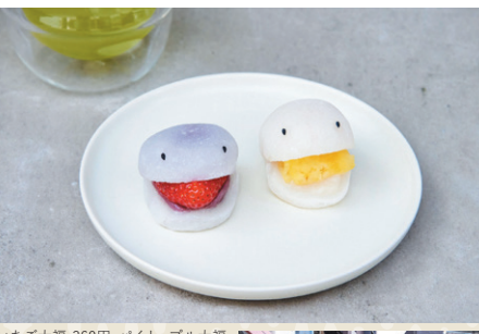
いちご大福 360円、パイナップル大福 310円、つゆひかり(緑茶)200円 ※すべてテイクアウト価格

看板商品の「妖怪大福」は、甘いフルーツの香りに誘われて谷中の墓地からやってきた食いしん坊な妖怪をイメージ。季節のフルーツをくわえる様子がかわいらしく、日暮里の手土産にも喜ばれています。伝統の和と新しさが融合したお菓子と一緒に、このエリアで仕入れている日本茶もどうぞ。