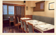
「四季折々の食材を使うことも大事にしており、春にかけは、実家の裏山で育った山菜や菊を使った料理も登場する予定です」