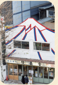
〒千代田区神田小川町2-4 優美堂 ☎ 03-3291-8341 ☎ 月・火・木・日/11:30~18:00 金・土/11:30~21:00 ☎ 水

戦後縁縁専門店として開業し、千代田区の文化遺産とも言われた看板建築の代表格「優美堂」。この価値を再発信できるような建物をリノベーション、2021年にギャラリーやカフェを備えるコミュニティアート施設として生まれ変わりました。