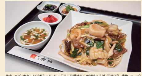
牛肉・エビ・ホタテが入った、たっぷり五日醤油あかけ焼きそば (前菜2品・香物・スープ) 1,400円 (焼きそばはご飯に変更も可能)