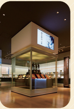
〒千代田区神田駿河台1-1 明治大学アカデミーコモン地下1階 ☎ 03-3296-4448 ☎ 月~金/10:00~17:00(入館16:30まで) 土/10:00~16:00(入館15:30まで) ☎ 日・祝・8/1~9/19の土

誰もが知る歌謡曲の作詞を多数手がけた阿久悠。没後、多くの人に生前の活動を知らせてもらうため、出身校である明治大学に寄贈された自筆原稿や資料を展示すべく設立されました。自宅書斎の再現や数々の受賞トロフィーや盾は必見です。