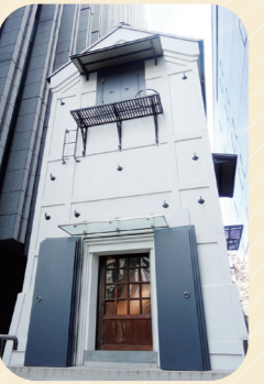
〒千代田区神田駿河台4-6 御茶ノ水ソラシティ ☎ 一般公開日(展示のない日) 水/11:00~19:00、土日祝/10:30~18:30

書籍商の書庫蔵として1917年に上棟し、その後「淡路町画廊」として親しまれてきた蔵を、ギャラリーとして復原。蔵ならではの空間を生かし、日本の伝統芸術の展示はもちろん、最近ではデジタル映像作品の投影などにも使われています。