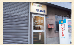
「初めてでもプランクがあっても、自前ビリヤードオタクな私たちがフォローするので、まずは一歩踏み出してみませんか」