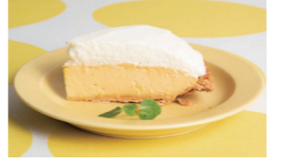
レモン画翠 〒千代田区神田駿河台2-6-12 ☎ 03-3295-4681 ☎ 平日/10:00~20:00 土・祝日/11:00~19:00 ☎ 無休

レモン画翠から徒歩5分ほどの場所にある系列の飲食店「トラットリアレモン」。ショッピング後は、工芸家の手によるお洒落な空間で名物「レモンパイ」を味わってみては?