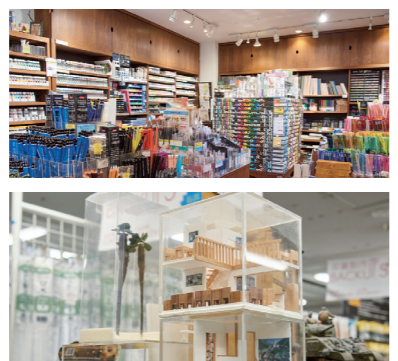
建築学生の優秀な卒業設計展「レモン展」は、1978年のスタート以降毎年開催。プロの建築家の登壇門としても知られ、優秀作品はショーウィンドウにも飾られます。

レモン画翠の前身、洋画材料商店「今井鐵次郎商店」の創業は大正12年。戦中戦後の商売の危機を乗り越え、100年の時を越えて、今もなお建築や芸術に従事する人を支えている総合美術専門店です。中でも建築に携わる人を一番近くで支えたいという強い思いから、模型材料の豊富さは日本でも随一。1階は直輸入している個性豊かな雑貨も揃い、一般の方でも楽しめるラインナップになっています。