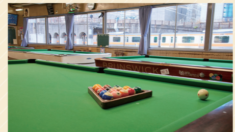
ゲーム料金 一般2人まで600円、3人以上540円(お一人さま・1時間の料金)