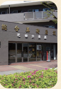
☎ 文京区本駒込6-14-14 ☎ 03-3941-7995 ☎ 月～金/9:00～19:00 土/9:00～12:00 ☎ 日・祝

木製金文字からLED看板まで、企画、設計、施工すべてを手掛ける看板の専門会社。約70年の歴史の中では、寺院や学校の看板を手がけた事例も。何気なく見ているランドマークや店舗の看板も花田文栄堂が手がけているかもしれません。