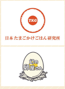
☎ 文京区本駒込5-72-1 101-1

たまごかけごはんのシンプルで変わらない、おいしさを追求したい想いから設立された研究所。たまごかけごはんの「究極」を目指した食べ方やトッピングを研究しつつ、日本各地で「幻の卵屋さん」というポップアップショップも開催しています。1/19～28はODAKYU 湘南GATEで開催予定!