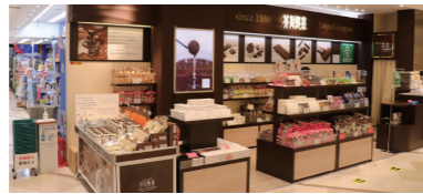
池袋ショッピングパーク内には直営店も。「毎年2月と3月には池袋サンシャインシティでアウトレットセールも開催しているので、詳しくはHPをチェックしてください」

「実はもともと社員やお取引先のために作られたのですが、その人気から一般販売するようになったんです」 スペシャルミルクチョコレート 1箱 (350g) 1,404円