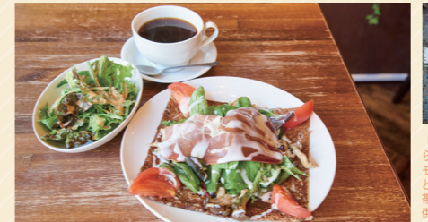
彩り野菜と生ハムのガレット 1,280円(+300円でセットサラダ)、ブレンドコーヒー 430円

オーナーの関根さんが「人と人をつなぐ港のような役割のカフェを」という想いではじめた、開放的なムードでくつろげるカフェ。看板メニューのガレットは北海道産のそば粉100%を使用。香りが引き立つようブレンドし、ぱりりと焼き上げています。どの時間帯に訪れても楽しめるのが、近隣の方から愛される理由です。