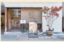
「鶏ひつまぶしのほかに、ランチは親子丼や、2種類から選べる鶏の唐揚げも。休日ランチはお子様連れも多いですよ」

重厚な店内で提供されるのは、熊本県の天草大王地鶏をメインに使ったこだわりの鶏料理の数々。一押しはランチメニュー、炭火焼き鶏ひつまぶしは、旨みがつまった鶏肉を炭火で香ばしく焼き、オリジナルのたれで和えたものがお米の上にとっぴり。薬味やお出汁を使いながら、お好みの食べ方でいただけます。