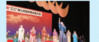
(次回開催予定) 令和4年春季大会 6/22(土)・23(日) 【文京シビックホール】 令和4年全国大会 10/18(金)～20(日)【さいたま文化センター】

私たちは、日本全国に必ず存在している民謡の魅力を、より多くの人に知ってもらうための活動をして