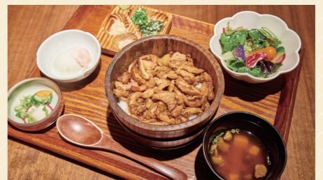
限定鶏ひつまぶし膳 2,090円(前菜3種、鶏ひつまぶし、お出汁、薬味、温泉卵、サラダ、お新香、味噌汁)

重厚な店内で提供されるのは、熊本県の天草大王地鶏をメインに使ったこだわりの鶏料理の数々。一押しはランチメニュー、炭火焼き鶏ひつまぶしは、旨みがつまった鶏肉を炭火で香ばしく焼き、オリジナルのたれで和えたものがお米の上にとっぴり。薬味やお出汁を使いながら、お好みの食べ方でいただけます。