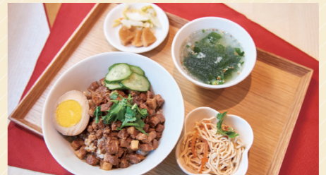
當肉飯ランチセット (小鉢・スープ・お漬物・ドリンク付) 1,100円

「魯肉飯は、日本に住んでいる台湾人がわざわざ食べに来るのよ」と話す、オーナーの劉さんが作る数々の台湾料理は、ローカル感もありつつ、食べやすいのが特徴。台湾野菜の炒め物や、台湾の国民食でもある焼きビーフンも大人気で、旅行に行かずとも現地の味に触れられます。