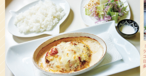
ハンバーグマトチーズ焼きセット 1,000円

住宅街に佇む緑色(ドア・窓・植物のグリーン!)が目印のキッチンぴーなっつ。都心でフレンチレストランを営んでいたご夫婦が作る料理は、本格的かつやさしい味で近所の方を虜にしています。トマトソースやペシャメルソースはすべて手作り。人気のハンバーグやソースヒレカツのお肉は、西尾久のお肉屋さんから毎朝届けてもらっているとのこと。地域のつながりを感じるあたたかいお店です。