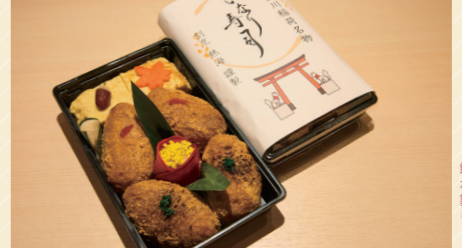
鎮守豊川稲荷名物 いなり寿司 1,000円

大正6年創業、100年以上この地で続く老舗割烹・熱海。週末の店舗営業に加え、この春から月曜・火曜に限定30食の販売を始めた「鎮守豊川稲荷名物 いなり寿司」が大人気です。店の鎮守として敷地の一角に豊川稲荷をおまつりしていた縁で、店主が季節毎に内容を変えて作っている稲荷寿司は、食感や素材、食べ応えなどを考え抜かれた逸品です。