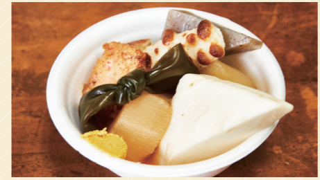
大根80円~、紅しょうが入りとま揚げ・結び昆布40円、こんにゃく黒60円、はんぺん120円、焼きちくわ70円

おでん種がたっぷり浮かぶ店先のおでん鍋と出汁の香りに釣られるように、屋前から夜まで多くのお客さまが訪れる大阪屋。不動の人気を誇る大根、白滝などのオーソドックスなものから、お店オリジナルのイタリア揚げまで、季節を問わず常時多くのおでん種が揃います。鶏ガラベースのおでん出汁は継ぎ足され続け、揚げ物はすべて手作り。創業から100年近く愛される味は、一度食べるとやみつきです。