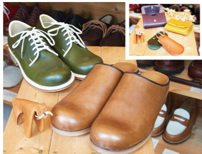
革靴: サボ48,400円~、外羽根47,300円~ 小物: 財布15,400円、キーケース6,380円、動物の置物1,980円