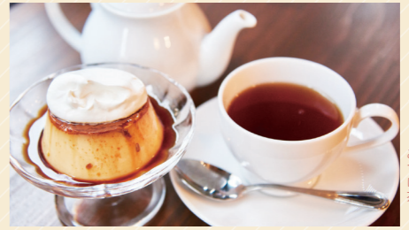
プリン450円、ケルルワース(ホット) 600円

一步店内に入ると、食パンをはじめ、どこか懐かしさを感じる10数種類のパンやスイーツが並ぶベーカリー&ティールーム。パンやスイーツ作りを生業にしているオーナーと、紅茶に精通したママがあたたかく迎えてくれるお店は、つい長居をしたくなる空気が流れます。「じんわりおいしいものをお出ししたい」と話される通り、毎日食べたくするようなシンプルでおいしいパンが人気です。