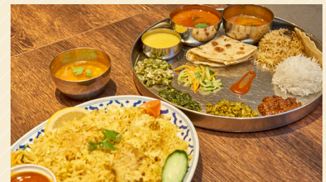
フィッシュ・ダム・ビリヤニランチ 1,650円、ドス・ミシャリ・セットランチ 1,450円