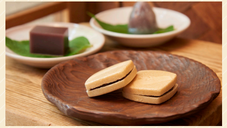
水羊羹・久寿桜 (9月上旬まで) 各380円、松葉最中150円