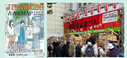
「神田古本まつり」は、28日・29日の週末がもっとも賑わうはず。掘り出し物もたくさん見つかると思うので、1日かけて神保町を歩いてみてください」

毎年春と秋に開催される神田古本まつり。今年の秋は、10月27日(金)~11月3日(祝・金)に開催されます。普段、古書店に入ることを躊躇しがちな人も、この期間は道路にたくさんの古本ワゴンが並ぶので手軽に古本を手にとれるチャンス! 特にお目当ての一冊がなくても、まちを歩くだけでたくさんの本やお店と出会えます。好みの本を見つけたら、本に貼ってあるラベルや、古書店名をチェック! 自分の欲しい本、興味のある本が置いてある古書店がどこなのかを知ることで、行きつけの古書店ができるかもしれません。古書店は本を売るだけでなく、好きなジャンルの情報を教えてもらえる場所でもあるので、1冊、1店舗との出会いを大切にすると、自分の世界も広がりますよ。『JIMBOCHO古書店MAP』を手に、まちを散策してみてくださいね。