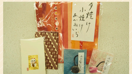
和紙セット1,595円、手づくりカード・ハガキ132円~275円、千代紙結び495円