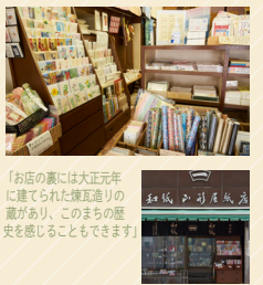
「お店の裏には大正元年に建てられた煉瓦造りの蔵があり、このまちの歴史を感じることもできます」

1879年創業の山形屋紙店は、手すき和紙や半紙、ちぎり絵用の和紙から、和紙で作られた封筒や便箋、ハガキに加え、アクセサリーなどの小物までが所狭しと並びます。若い方や外国の方も手に取ることが多いオリジナルで作られたハガキやポチ袋、アクセサリーは、種類もさまざま。紙によって風合いや色合い、手触りまでが違い、一度店内に入ると和紙の奥深さをよく知ることができます。