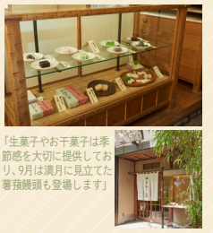
「生菓子やお干菓子に季節感を大切に提供しており、9月は満月に見立てた善哉餅頭も登場します」

1929年に初代がパン屋を創業したことから歴史が始まる。老舗和菓子店。笹が揺れる入り口の戸を引いて中に入ると、ケースの中には季節ごとの生菓子や伝統的な和菓子の数々が。特に「松葉最中」は、季節問わず多くのお客さまがお土産に求めるとのこと。パリッとした香ばしい皮に、さらりとした上品な甘さの餡子がたっぷり挟まり、どんなシチュエーションにも喜ばれる一品です。