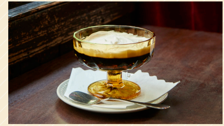
ラドリオ特製 コーヒーゼリー 650円