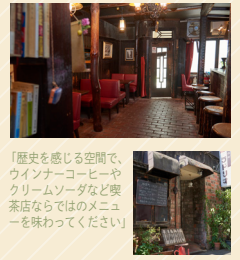
「歴史を感じる空間で、ウインナーコーヒーやクリームソーダなど喫茶店ならではのメニューを味わってください」

書店の一角でコーヒーを出したのが発端で人が集うようになり、屋は喫茶店、夜はバー代わりに使われるようになった創業1949年のお店では、時間がゆっくり流れます。看板メニューの一つでもあるコーヒーゼリーは苦味が効いたゼリーに、ブランデーの香り豊かな生クリームがたっぷりのった大人の味。ランチタイムのナポリタンも人気です。