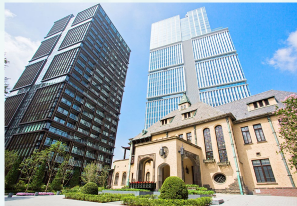
千代田区紀尾井町1-2 他 https://www.tgt-kioicho.jp/

1955(昭和30)年から2011(平成23)年まで、この地のシンボリック的存在だった通称“赤プリ”こと「グランドプリンスホテル赤坂」。その跡地が、オフィス・商業施設、住居、ホテルが融合した一つの“街”として生まれ変わりました。国際都市・東京の中心施設としての役割・機能をもちながら、江戸から続く紀尾井町の歴史的価値も継承。さらに敷地の約45%を占める緑地には、野鳥や様々な生き物が息する「都市のオアシス」です。その先端的な都市機能と豊かな自然に加え、歴史や文化、季節などをテーマに多彩なイベントも催されます。ここは働く人、住まう人、訪れる人をやさしく包み、そして新たな刺激と感動が生まれる“街”です。