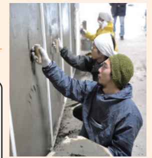
↑塗り壁トレーニングの様子

業を撮影した動画を参考に、塗る手順や動きを真似ることで技術を学び、本人の塗り姿も撮影して手本との違いを確認・補正していくことで、短期間に効率よく技術を取得できるようになりました。2017年には左官同業8社で共同訓練所(東京左官育成協会)も開設。今後も仲間とアイデアを出し合いながら、現代にあった人材育成をしていきたいと思っています。また、左官の魅力を広めたいと、ショールーム見学や、販売かまどの販売なども行っています。ご興味のある方はぜひどうぞ(見学は要予約)。