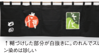
↑糊つけた部分が白抜きに。のれんでスレン染めは珍しい