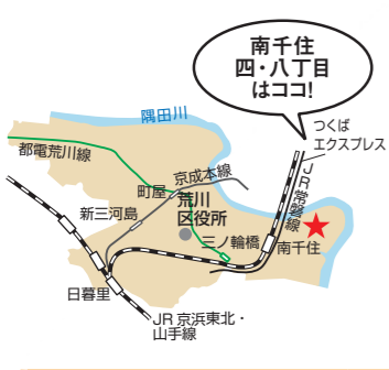
南千住四・八丁目はココ