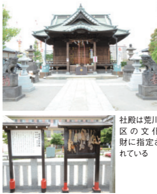
社殿は荒川区の文化財に指定されている