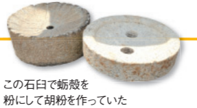
この石臼で蛸殻を粉にして胡粉を作っていた